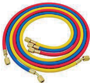
Mangueras F1/4 RECTO 2000MM

Herramienta especializada para el mantenimiento y reparación de sistemas de aire acondicionado en automóviles.